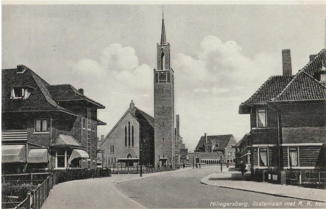
Figuur 3 De Christus Koningkerk aan het Statenplein met de omliggende buurt, ontworpen rond de kerk en met de er bijbehorende buurtfuncties.

Architect De Vries krijgt in 1928 de opdracht tot het ontwerpen van de Christus Koningkerk. Ook het complex rondom de kerk met school, parochiehuis en pastorie is van zijn hand. Een jaar later, in 1929, krijgt aannemersbedrijf Gebroeders Kwaaitaal de opdracht voor de bouw. De kosten zijn fl. 375.000,--.