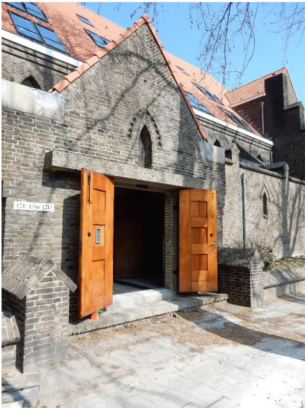
Figuur 7 De getransformeerde Christus Koningkerk tot wooncomplex De Statenkoning

Door deze constructie kan er om het appartementengebouw worden gelopen en is het hele voormalige schip van binnen nog zichtbaar en te beleven. De nieuwe eigenaar is trots op haar unieke monument en de mooie transformatie. De Vereniging Stedebouwkundig Wijkbehoud (VSW) heeft dit beloond met een schildje. In maart 2019 nemen de eerste huurders hun intrek in de voormalige Christus Koningkerk, die nu de naam De Statenkoning draagt. Sommige huurders vinden het heel bijzonder om in een voormalige kerk te wonen. Anderen zijn juist afgehaakt om deze reden. Ook de stedenbouwkundige sfeer en het Statenlaankwartier op zich zijn voor sommige huurders doorslaggevend geweest om hun intrek te nemen.