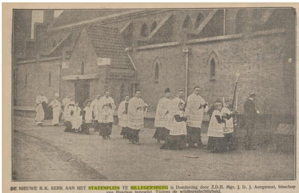
Figuur 6 Uit 'De Tilburgsche courant' van 13 december 1930

Om hier gelukkig te kunnen zijn wordt een heel systeem opgebouwd rondom het sociale leven van de mensen. Volwassenen hebben zitting in een bestuur, zijn deel van Vincentius, dat 'nooddriftige gezinnen bijstaat', zitten in het zangkoor, regelen de bibliotheek en het 'Zilvervloot sparen'. Jongeren zijn lid van 'de Katholieke Kring', scouting, een muziekbond, een koor of andere Rooms-Katholieke verenigingen. De kinderen bezoeken de Rooms-Katholieke jongens- of meisjesschool aan de Johan de Wittlaan en doen onder andere hun Eerste communie en Plechtige communie. Aan de Statenlaan is het jongenshuis Don Bosco gevestigd, waar Rooms-Katholieke jongens worden opgevoed door broeders. Het gebouw van de Christus Koningkerk en de parochie is het centrale punt in veel levens van parochianen op belangrijke momenten in het leven: er wordt gedoopt, getrouwd, begraven, gevierd en herdacht.