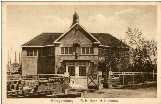
Figuur 1 De eerste Rooms-Katholieke kerk in Hillegersberg dateert van 1925 was een ontwerp van de Rotterdamse architect Jan van Teefelen.

Na de gemeenteraadsverkiezingen van 1927 had de Room- Katholieke Staatspartij (RKSP) in Hillegersberg één van de zeventien zetels. Na de verkiezingen van 1931 waren dat er drie van de zeventien. In Schiebroek bleef de RKSP twee zetels houden, ondanks de uitbreiding van het aantal raadszetels van acht naar elf. Tijdens de bouw van het Kleiwegkwartier in de jaren twintig en dertig werden er drie kerken gebouwd. Eén daarvan was de Christus Koningkerk .