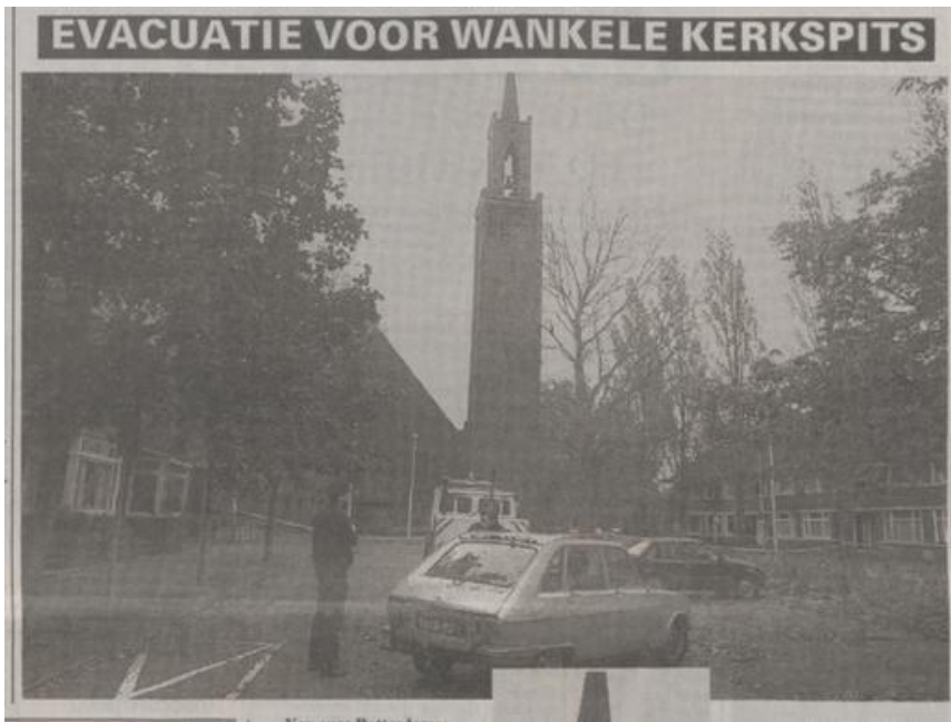
Figuur 5 De Telegraaf van 5 november 1991

Op 4 november 1991 raakten de vier pijlers waarop de spits rust ernstig beschadigd als gevolg van een blikseminslag. Het bovenste deel van de toren werd direct gesloopt. De klok verdween na veertig jaar uit de toren. Het geld, dat de parochie van de verzekering ontvangt voor de herbouw werd belegd. De jaarlijkse opbrengst wordt aangewend om de dan al sterk gekrompen parochie te ondersteunen.